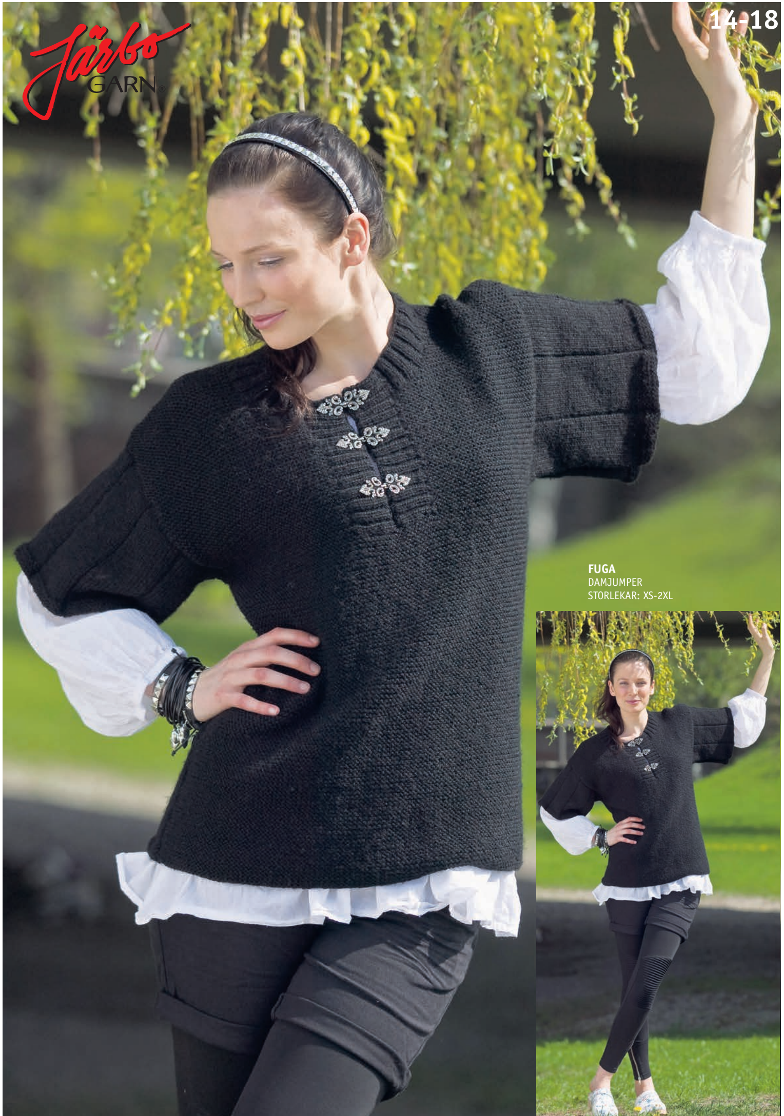
FUGA DAMJUMPER STORLEKAR: XS-2XL